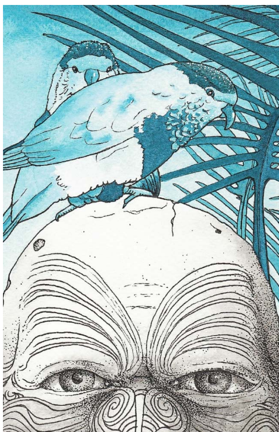
Les illustrations sont d'Adelaïde Lebrun.

La sortie du « Maître-du-Jour », un livre peu connu de Victor Segalen, donnera lieu, les 29 et 30 septembre à Brest, à une conférence à l'université de Bretagne Occidentale et à une séance de signature à la librairie Antinoë.